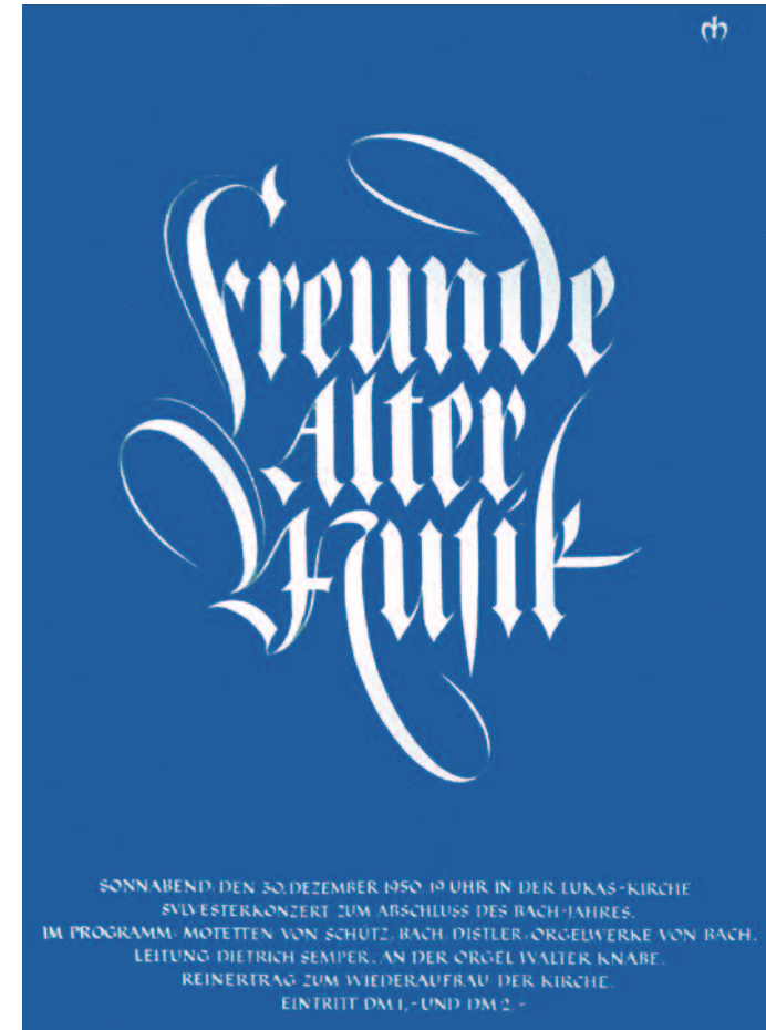
Helmut Matheis Kalligraphischer Entwurf für ein Konzert, 1989

Wir bitten um Anmeldung per Telefon oder Email.