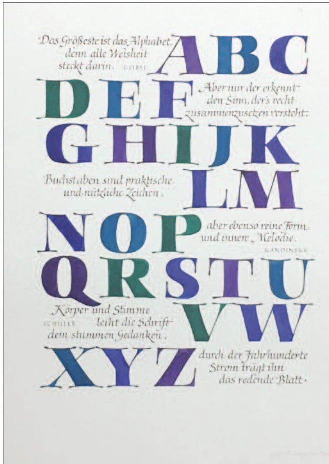
Gudrun Zapf von Hesse Alphabet-Text-Komposition, 1980